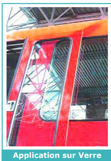
Application sur Verre